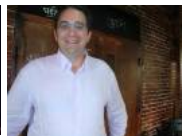
AZM veut affermir (...)